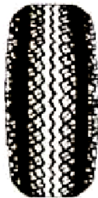
For lite luft