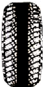
For mykje luft